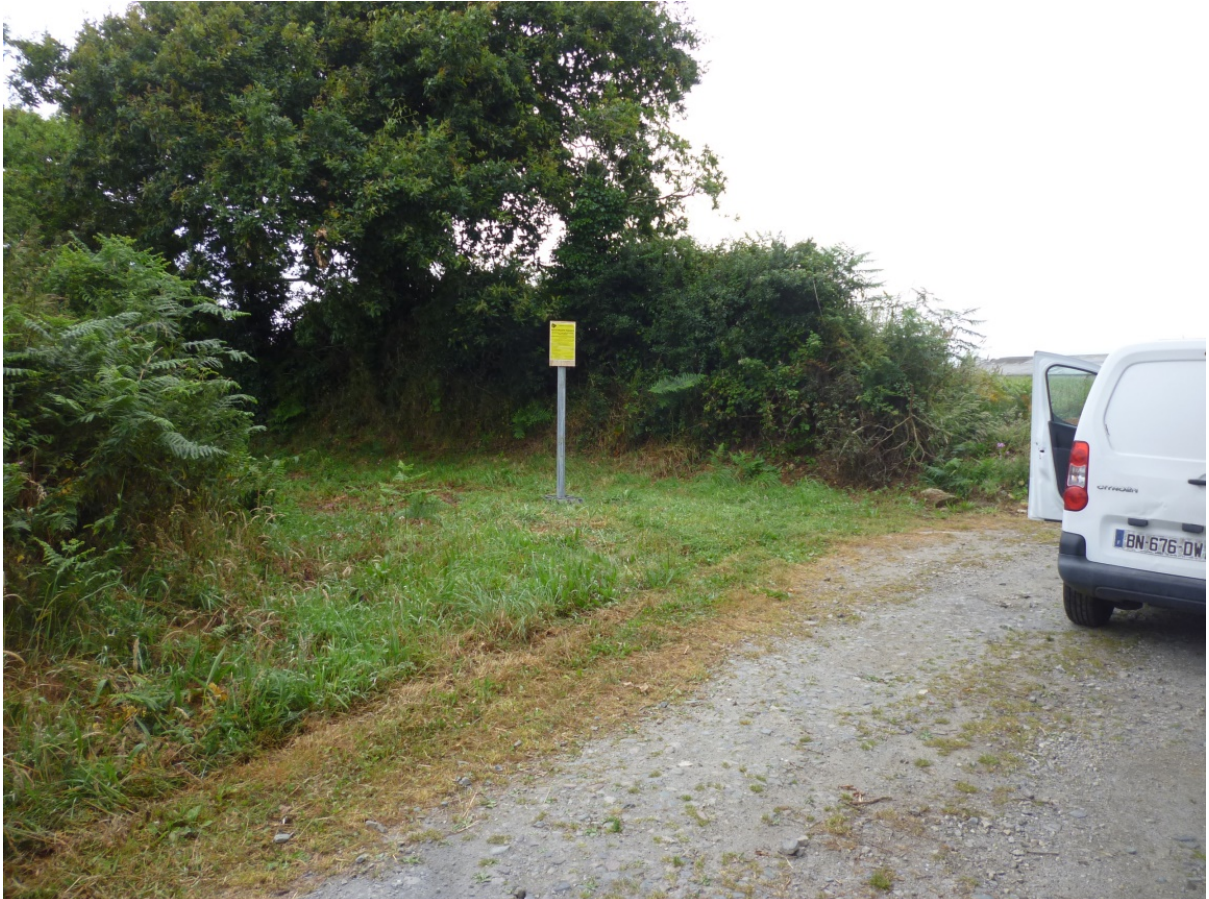
Vue sud-ouest du chemin