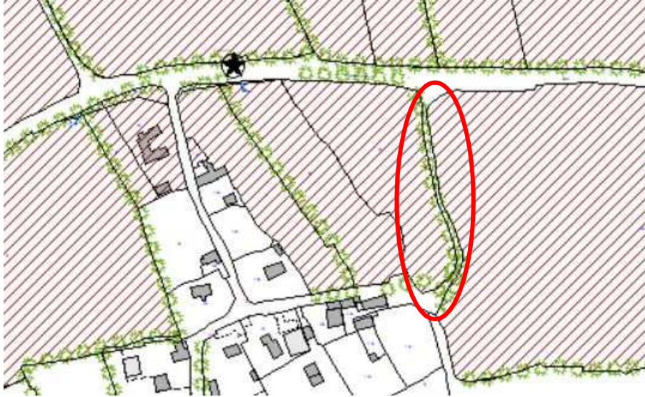
Extrait du Plan Local d'Urbanisme

Il se situe également dans un périmètre de présomption de prescriptions archéologiques.