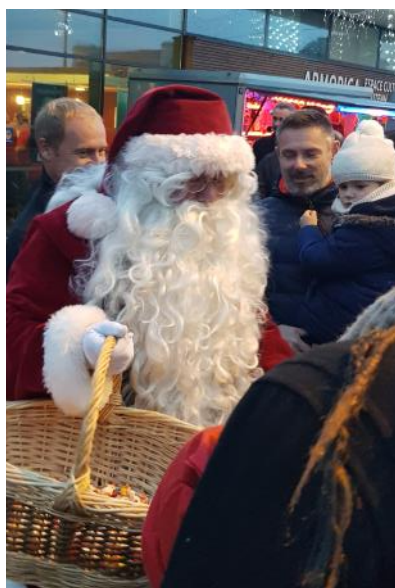
Mairie de Plouguerneau

SAMEDI 14 DÉCEMBRE | 15H-20H | ESPACE ARMORICA