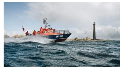
SNSM de Plouguerneau

La commune de Plouguerneau est mise à l'honneur deux fois dans les deux derniers numéros de la revue ArMen : un article sur les travaux du phare de l'île Vierge (n°233 de novembre - décembre 2019) et un autre sur la SNSM de Plouguerneau (n°234 de janvier - février 2020). Retrouvez-les à la médiathèque !