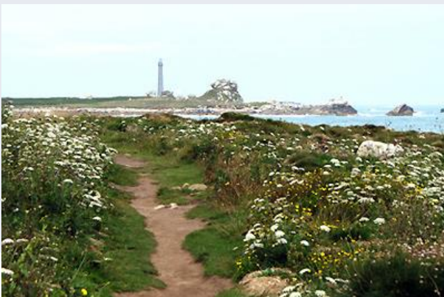
Étape Bretagne des Abers

Sur le sentier, il y a le risque de ne pouvoir respecter la distanciation physique si l'on croise un autre promeneur. Un mètre entre deux personnes peut s'avérer parfois dangereux voire impossible à certains endroits.