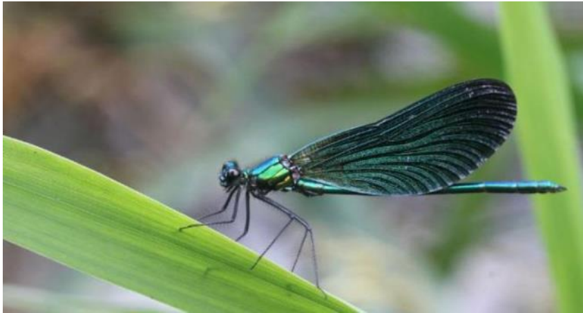
Eau et Rivières

L'association Eau et Rivières vous propose des animations, des expositions, des films, des conférences et ateliers, dans le cadre de sa nouvelle campagne régionale autour de la biodiversité des milieux aquatiques intitulée « Le temps de... ».