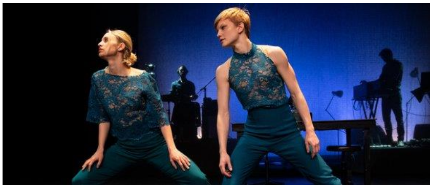
Compagnie Moral Soul

SAMEDI 26 SEPTEMBRE | 20H30 | DANSE | DÈS 8 ANS