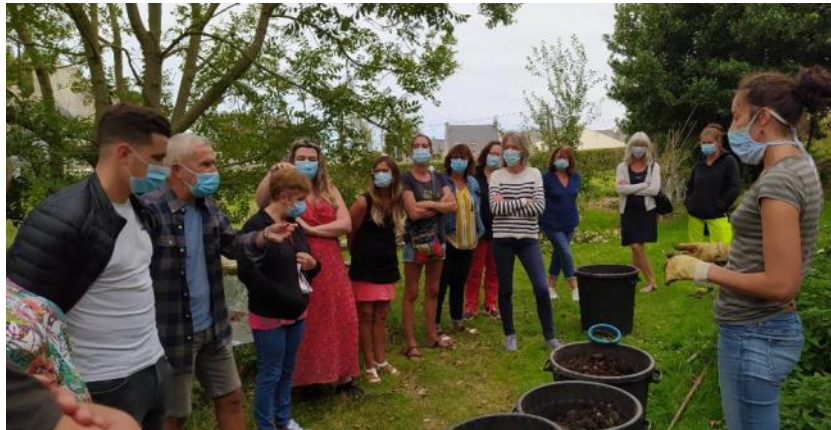
Mairie de Plouguerneau

Dans la réduction du gaspillage alimentaire, le compostage est un levier incontournable. À Plouguerneau, les agents municipaux intervenants sur les temps méridiens et dans les cantines des écoles publiques ont suivi une formation d'approfondissement avec l'association « Vert le Jardin ». À la clef : le développement d'un savoir-faire commun dans la pratique du compostage au sein de l'équipe.