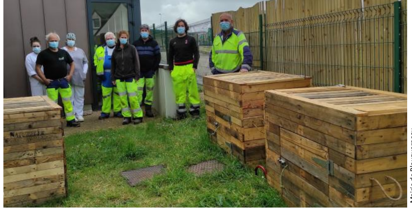
Mairie de Plouguerneau

À partir de bois de palettes recyclées, les agents ont conçu 6 nouveaux composteurs aussi solides qu'économiques. Exit donc les anciens composteurs en plastique.