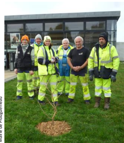
Mairie de Plouguerneau

Début novembre, un habitant s'est présenté aux services techniques, pour faire don à la commune d'un arbre dont il n'avait plus la place pour s'en occuper correctement.