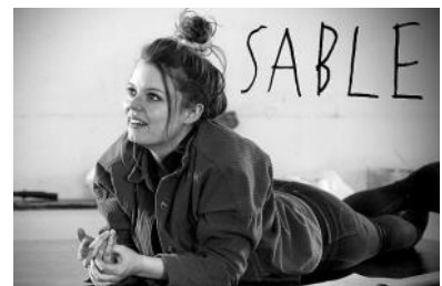
Théâtre du Grain

Début mai, l'équipe du Grain sera en résidence à l'Armorica avec sa nouvelle création « Sable » dont la sortie est prévue en novembre prochain. L'équipe vous invite à une présentation d'une étape de travail, suivie d'un temps d'échange. « Sable » est une pièce entremêlant théâtre, création sonore et visuelle. En suivant plusieurs chemins de vie, elle dresse un parallèle entre les luttes sociales et environnementales à partir d'une matière commune, le sable, ici symbole d'une biodiversité du vivant.