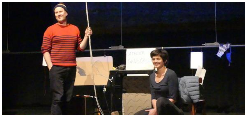
La Compagnie du Grand Tout

VENDREDI 29 AVRIL | 18H | THÉÂTRE ET MATIÈRES | DÈS 7 ANS