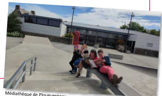
Médiathèque de Plouguerneau

Cette semaine on s'intéresse au « Où ? » : Parties en quête d'un lieu original pour s'adonner à la lecture, nos 3 bibliothécaires n'ont pas été bien loin : elles ont investi le... skatepark ! Un peu dur d'aspect, cet équipement en béton lisse s'est finalement révélé être confortable le temps de quelques pages ;)