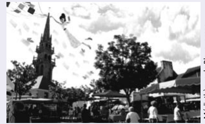
Médiathèque de Plouguerneau

Cet été, la bibliothèque est présente sur le marché de Plouguerneau, devant l'Office de tourisme.