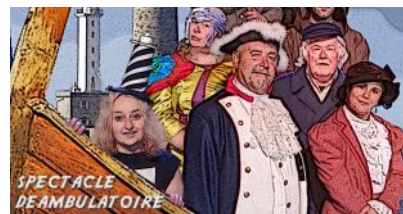
Cie Ar Vro Bagan

Le 29 juillet prochain, à 18h30, faites escale pour découvrir les personnages hauts en couleur de la troupe Ar Vro Bagan, pour un saut dans l'Histoire dans un cadre exceptionnel ! La quinzaine de comédien-ne-s redonnent vie au passé avec humour, passion et générosité. Avec eux, replongez dans les tourments de la Révolution française, faites la connaissance des frères Mineurs de l'Observance, courageux ermites du XVe siècle... Spectacle en français. Départ en bateau depuis le port de l'Aber Wrac'h. Réservation à l'Office de tourisme au 02 98 04 05 43 ou sur www.abers-tourisme.com