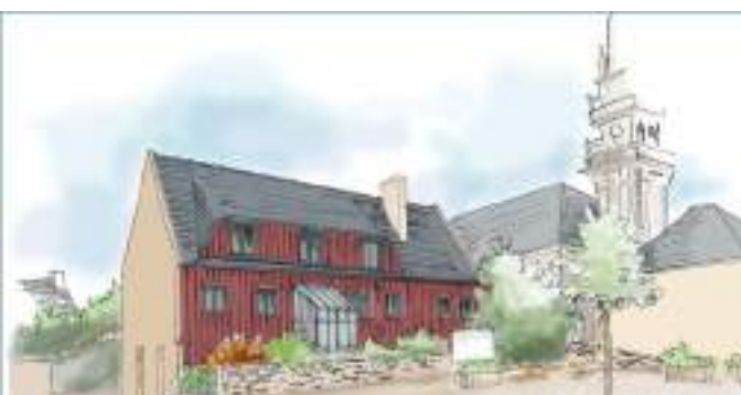
La maison paroissiale.