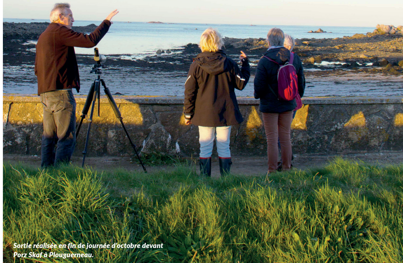
Sortie réalisée en fin de journée d'octobre devant Porz Skaf à Plouguerneau.

Passionnés ou curieux, les bénévoles ont aussi un rôle de transmission car leurs observations nourrissent l'inventaire de la biodiversité de Plouguerneau et permet de répertorier les espèces observées. Vous aussi, prenez le temps de regarder autour de vous. Que voyez-vous ?