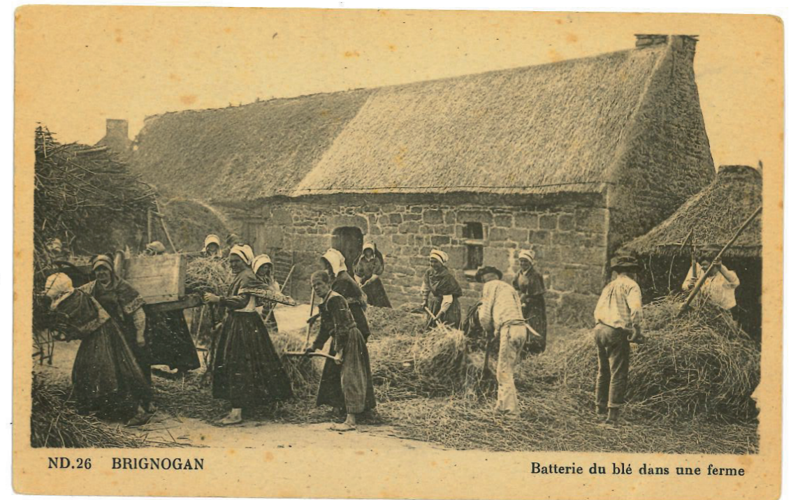
Un bel exemple dans le travail : An Dourna. Le Battage du blé au milieu du siècle dernier dans une ferme du Pays Pagan.